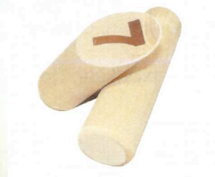
Paaltje 7 is niet omgevallen