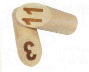
Paaltje 3 is wel omgevallen, paaltje 11 niet

Belangrijk: een paaltje geldt als omgevallen als deze volledig op de grond ligt. Als een paaltje gedeeltelijk op een ander paaltje of op de mólkky ligt, of er tegenaan leunt, scoort de speler er geen punten voor. Mocht een paaltje door het weghalen van de mólkky omvallen, dan wordt deze wel rechtop gezet, maar krijgt de speler er alsnog geen punten voor.