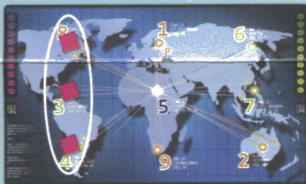
All three Western