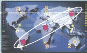
Drei auf der Hauptachse

Als Hacker erledigst du Aufträge für Geld und Ruhm. Deine Mission ist es, mit deinen Virus-Markern alle drei Server auf einer der Hauptachsen (3-5-7, 1-5-9, 8-5-2, 4-5-6) oder alle drei Server im Norden, Osten, Süden oder Westen (8-1-6, 6-7-2, 4-9-2, 8-3-4) zu infizieren oder einen Server durch einen Dreifach-Angriff (drei Marker auf demselben Server) zu zerstören.