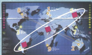
Ex.: Three on the main axis

You are a hacker completing missions for money and reputation. Your mission is to infect with your virus markers all three servers of a main axis (3-5-7, 1-5-9, 8-5-2, 4-5-6), or all three Northern, Eastern, Southern or Western servers (8-1-6, 6-7-2, 4-9-2, 8-3-4), or destroy one with a triple attack (three markers on the same server).