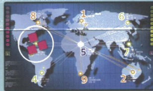
Three on the same server