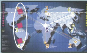
Drei im Westen