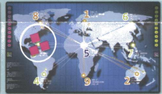
Drei auf demselben Server