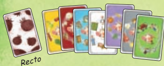
7 cartes Catégorie avec 7 couleurs de fond différentes