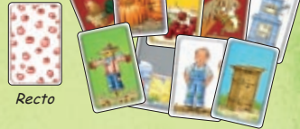
49 cartes Objet déclinées en 7 couleurs différentes