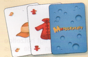
kledingstukken -3 punten