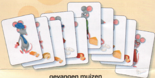
gevangen muizen +10 punten