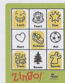
"Vorm een X"