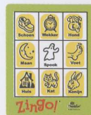
"Vorm een raam"

Spreek een patroon af. De eerste speler die het patroon behaalt is de winnaar!