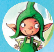
Wutzel (F Émery)