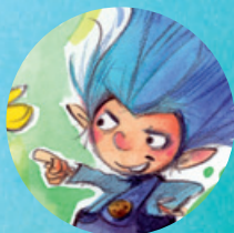
Wommel (F Azury)

Zieht jeder ein Aufgabenplättchen und legt es offen vor euch ab. Es zeigt euch, den Glückskristall, den es nun zu suchen gilt. Gespielt wird reihum. Der jüngste Spieler beginnt.