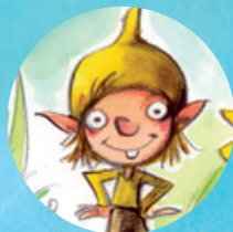
Wimmel (F City)