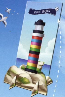
Le nombre situé en haut de la carte correspond au nombre de pièces constituant ce phare.