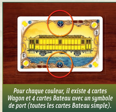
Pour chaque couleur, il existe 4 cartes Wagon et 4 cartes Bateau avec un symbole de port (toutes les cartes Bateau simple).

Il n'est pas obligatoire de construire des ports, mais chaque port non construit fait perdre 4 points à son propriétaire à la fin de la partie.