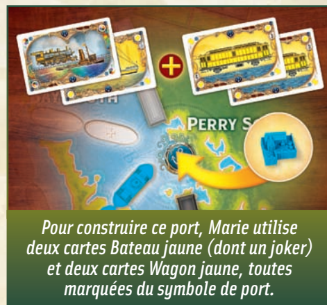
Pour construire ce port, Marie utilise deux cartes Bateau jaune (dont un joker) et deux cartes Wagon jaune, toutes marquées du symbole de port.