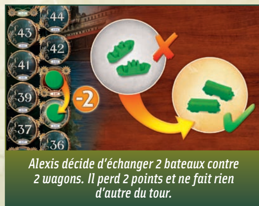
Alexis décide d'échanger 2 bateaux contre 2 wagons. Il perd 2 points et ne fait rien d'autre du tour.

Un joueur peut choisir de passer son tour pour échanger des pions avec ceux qu'il avait remis dans la boîte en début de partie. Il peut échanger des wagons contre des bateaux, et vice-versa. Chaque pion échangé de la sorte lui fait perdre un point. Un joueur peut faire cet échange autant de fois que nécessaire, à condition qu'il reste des pions du type voulu dans la boîte.