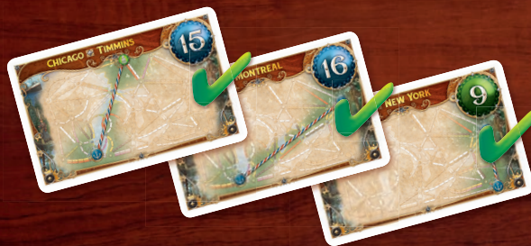
Elle a réussi les cartes Destination suivantes : Chicago-Timmins, Chicago-Montreal, Montreal-New York.

Le port de Chicago rapporte 20 points puisque la ville figure sur deux cartes Destination réussies.