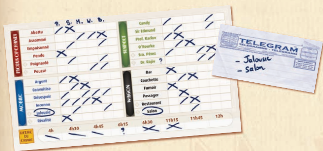
Le Mystery Express s'apprête à quitter Budapest... les joueurs envoient leurs télégrammes.

Si des joueurs ont correctement identifié le même nombre d'indices, c'est le télégramme envoyé depuis Budapest qui départagera les ex-æquo (voir Un télégramme important et Fin du jeu , p. 5).