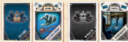
12 (6x2) cartes Mobile