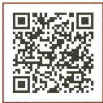
'aap kiest een kaart'